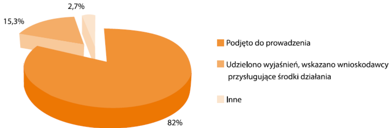
Sposób rozpatrzenia spraw