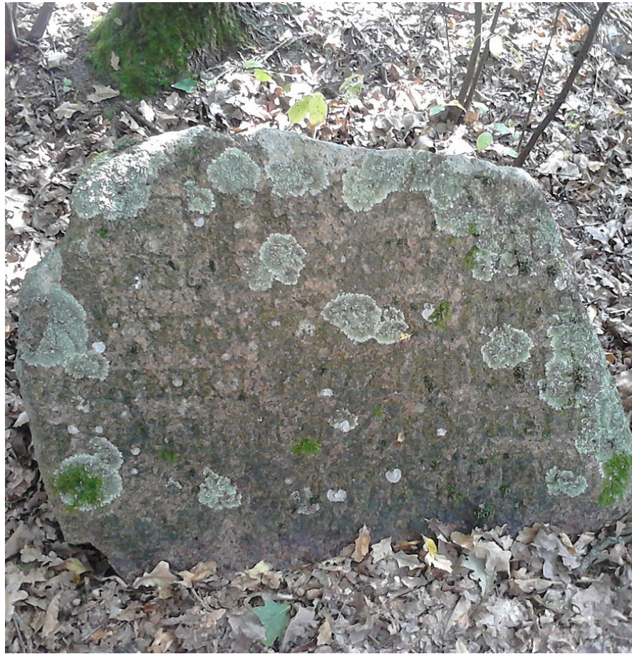
Lebiedziew. Cmentarz tatarski, nagrobek z polską inskrypcją.

W islamie nie ma wyznaczonych dni do odwiedzania zmarłych. Można każdego dnia przyjść i odwiedzić bliskich, by się pomodlić, ewentualnie uporządkować otoczenie grobu.