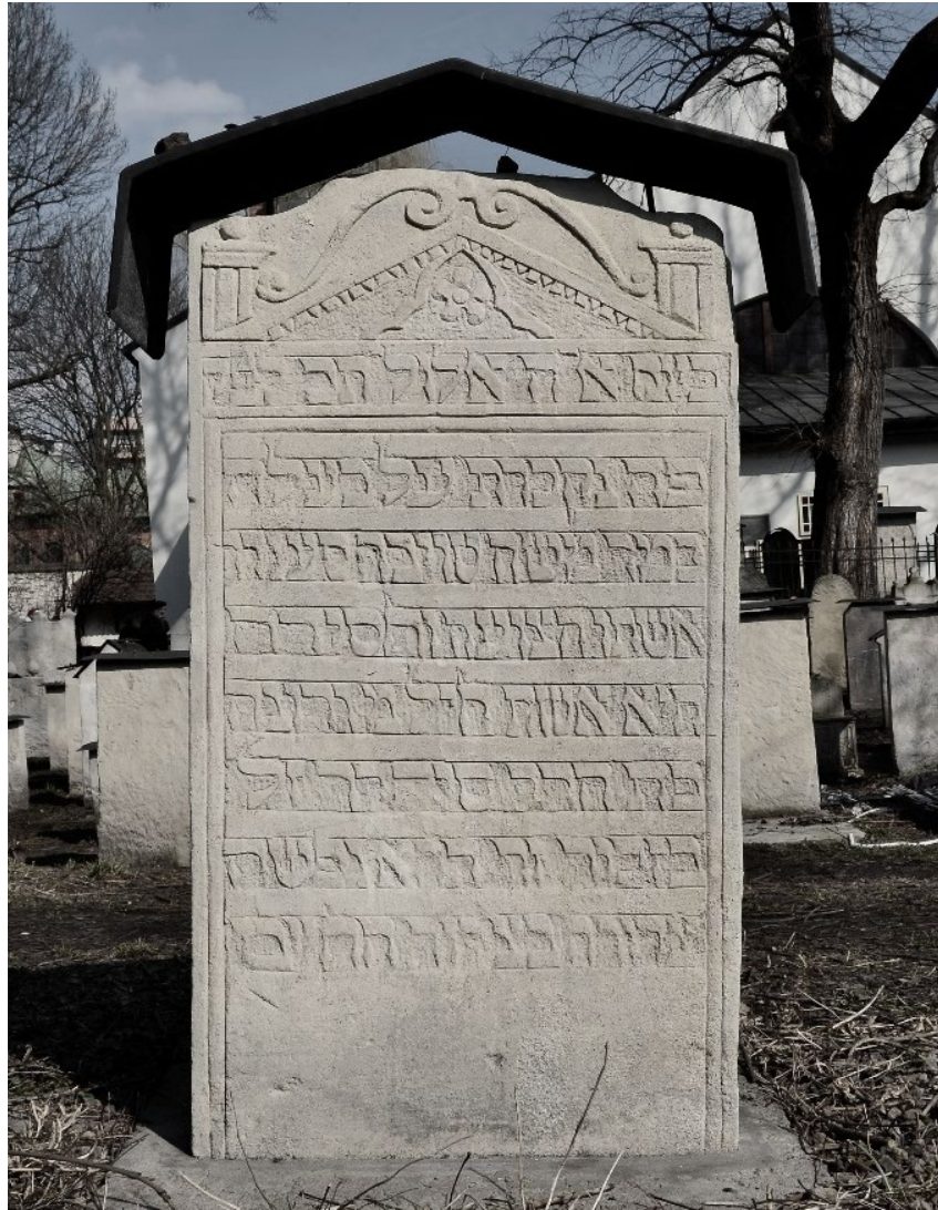
Cmentarz żydowski Remu w Krakowie

Podczas pobytu na cmentarzu mężczyźni muszą nosić nakrycie głowy. Oznaką oddania szacunku zmarłemu jest położenie na grobie kamyka. W ostatnich dekadach coraz częściej na nagrobkach widuje się kwiaty i znicze, nie jest to jednak tradycyjny zwyczaj żydowski.