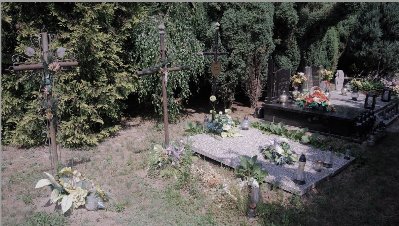
Cmentarz mariawitów w Zdunach koło Łowicza