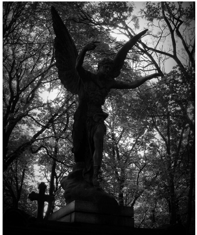
Cmentarz na Powązkach w Warszawie

Żałoba według tradycji trwała przeważnie rok. Dziś coraz więcej osób traktuje te wymogi bardzo indywidualnie. Coraz mniej osób, nawet tych z najbliższej rodziny, nosi czarny lub ciemny strój przez jakiś czas po pogrzebie. W rocznice śmierci zamawia się mszę za zmarłego.