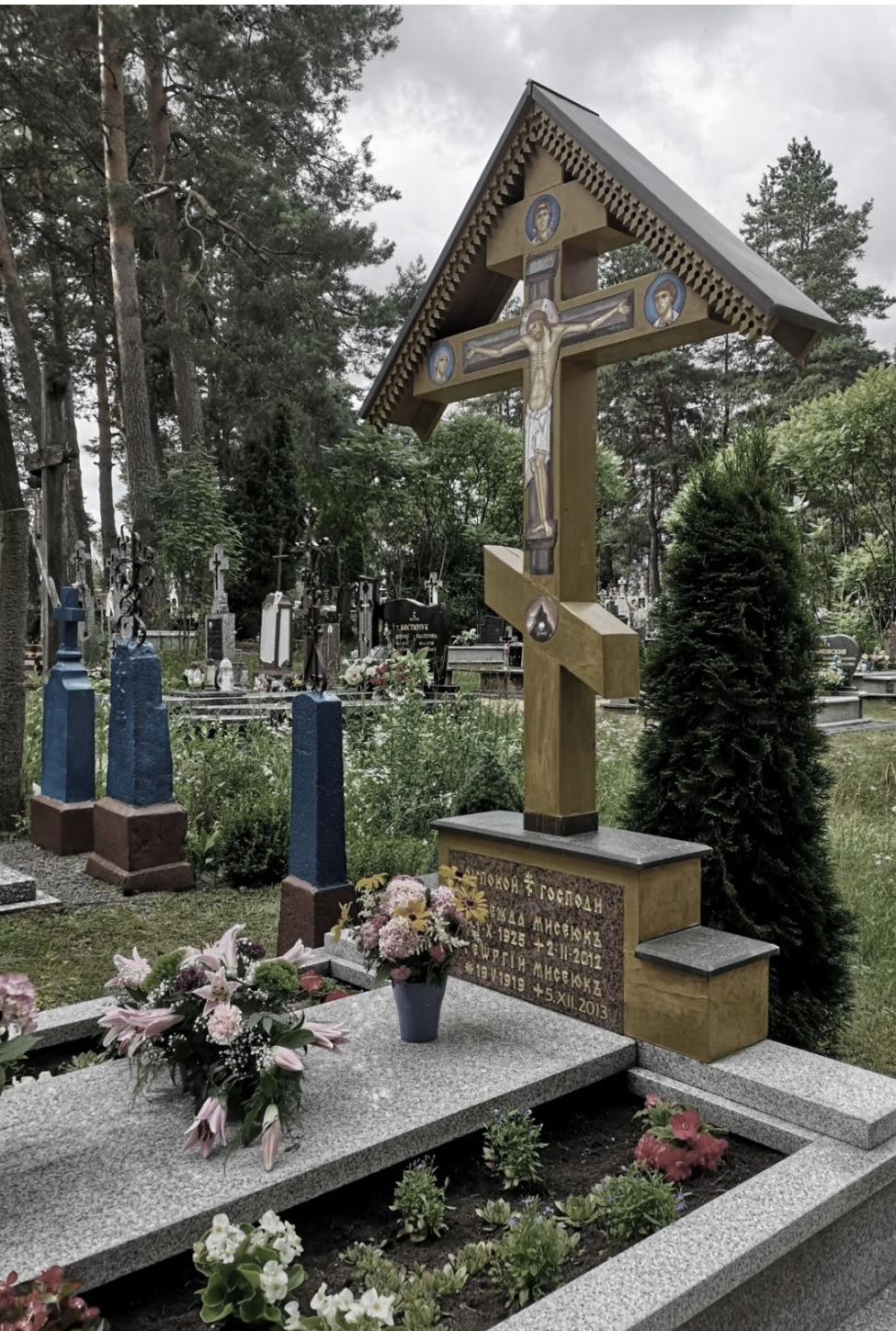
Cmentarz prawosławny parafii Czyże w powiecie hajnowskim

Pierwsi chrześcijanie zbierali się na nabożeństwa w katakumbach, gdzie Boską Liturgię sprawowali na grobach męczenników. Wspominali wówczas tych, dzięki którym żyli. My postępujemy podobnie. Odwiedzamy groby naszych bliskich, modlimy się za spokój ich dusz, zapalamy lampki oliwne, świece bądź znicze.