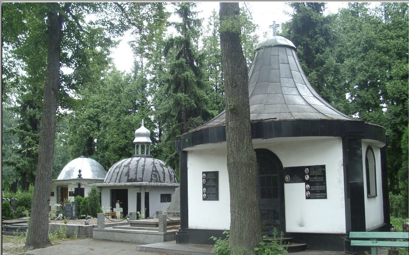
Cmentarz Komunalny we Wrocławiu przy ul. Osobowickiej.