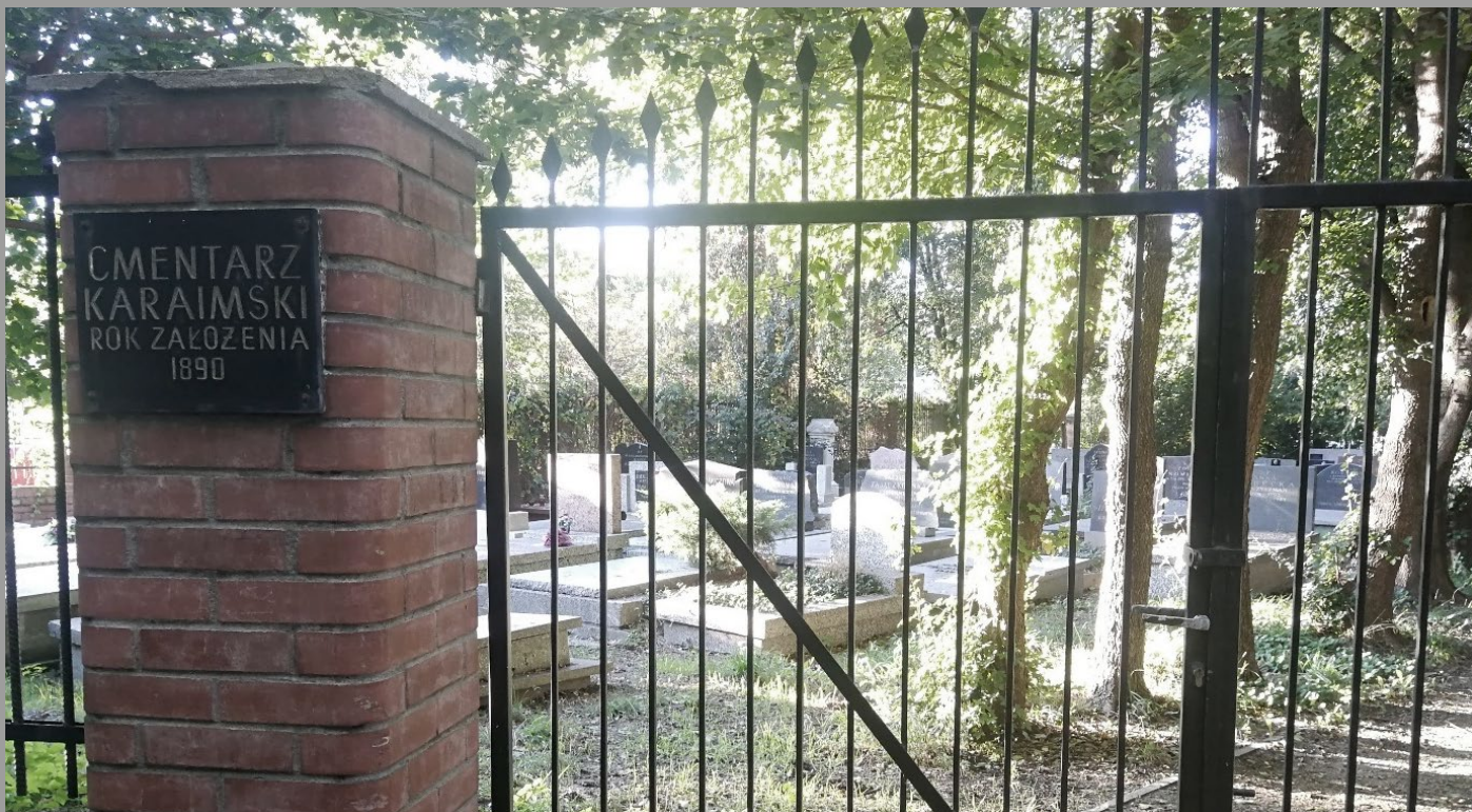
Brama cmentarza karaimskiego w Warszawie