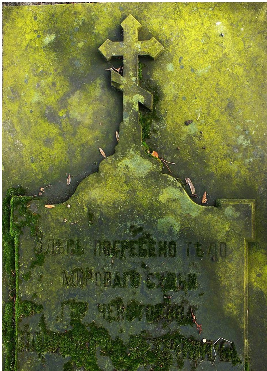
Cmentarz Prawosławny Częstochowa

Wszystkie śpiewy i czytania mają bardzo głęboką teologiczną wymowę. Jedną z ostatnich pieśni to osobista modlitwa zmarłego: