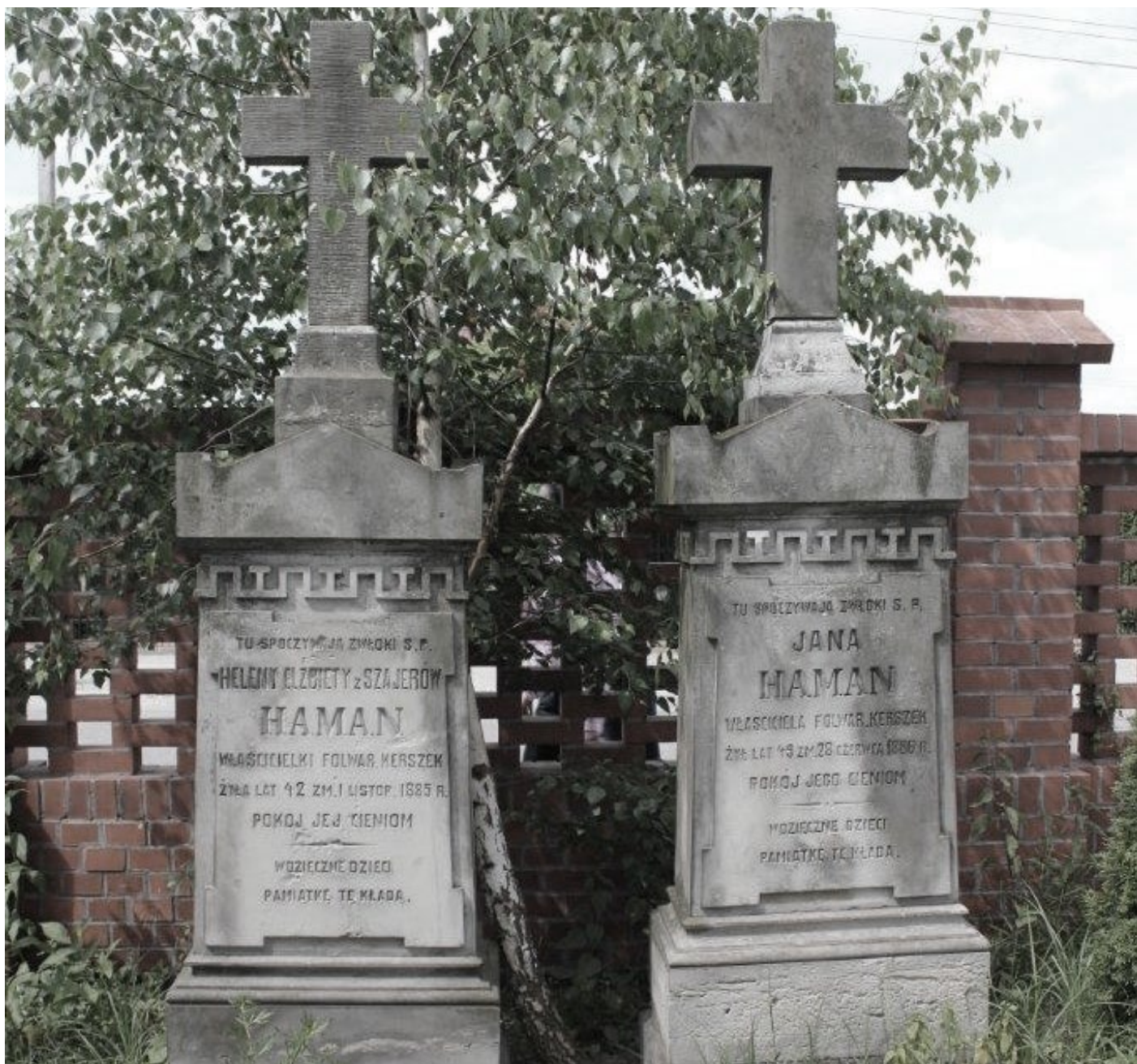
Cmentarz ewangelicko-augsburski w Nowej Iwicznej