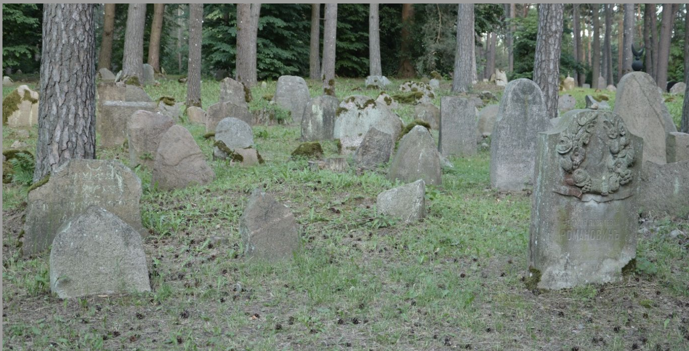
Mizar w Kruszynianach. Miejsce pochówku od 350 lat