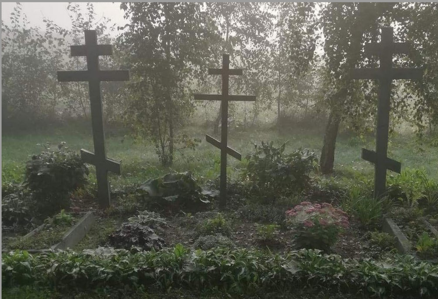
Cmentarz Staroobrzędowców w Gabowych Grądach