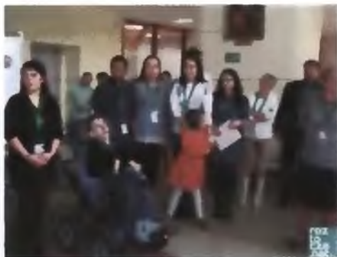
Żywa Biblioteka 2017: fot. Daniel Czubara

W tej bibliotece ludzie są książkami, a czytanie jest rozmową – tak wygląda Żywa Biblioteka, jaką dziś w Książnicy Zamojskiej zorganizowało Stowarzyszenie Pomocy Dzieciom Niepełnosprawnym „Krok za krokiem”.