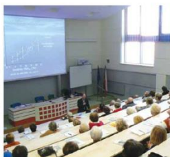
Wykład dotyczący zakupów uświadomił słuchaczom, jakie ryzyka wiąże się z tym, choroba